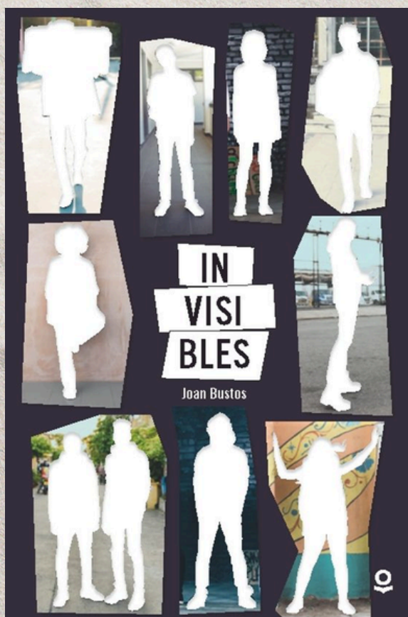
Portada del documental "Invisibles"