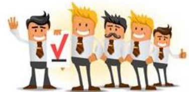
Treball en equip