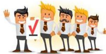
Treball en equip